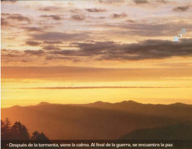
• Después de la tormenta, viene la calma. Al final de la guerra, se encuentra la paz.